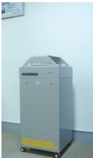
低柜型 最省空间的低柜型

TORNEX INDOOR AIR QUALITY CO., LTD. 上海统能克斯空气净化技术有限公司