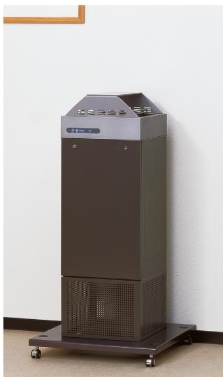
高柜型 适宜公共场所的高柜型