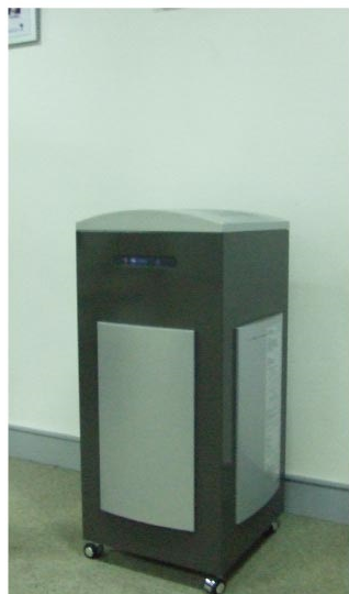
低柜型 流线型设计，款式新颖